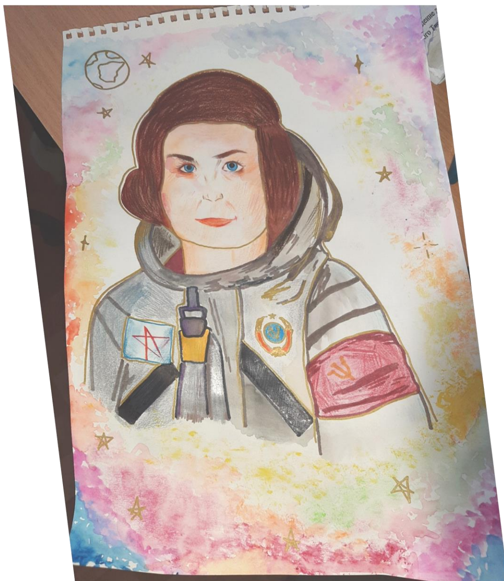
Участие во Всероссийском конкурсе рисунков «Космос глазами детей» посвященного 60-летию полета в космос Ю.А.Гагарина