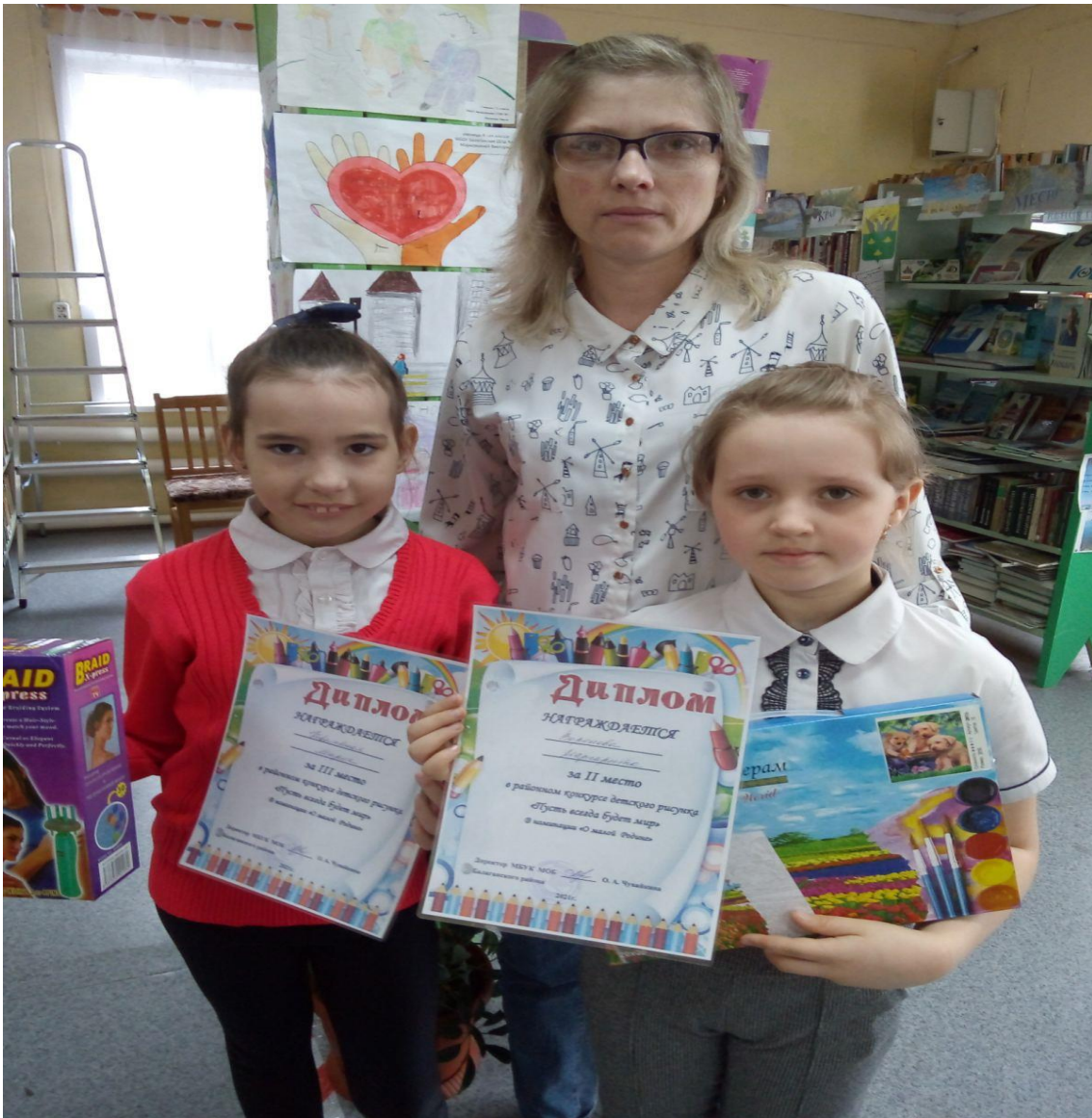
Участие в районном конкурсе рисунков «Путь всегда будет мир»