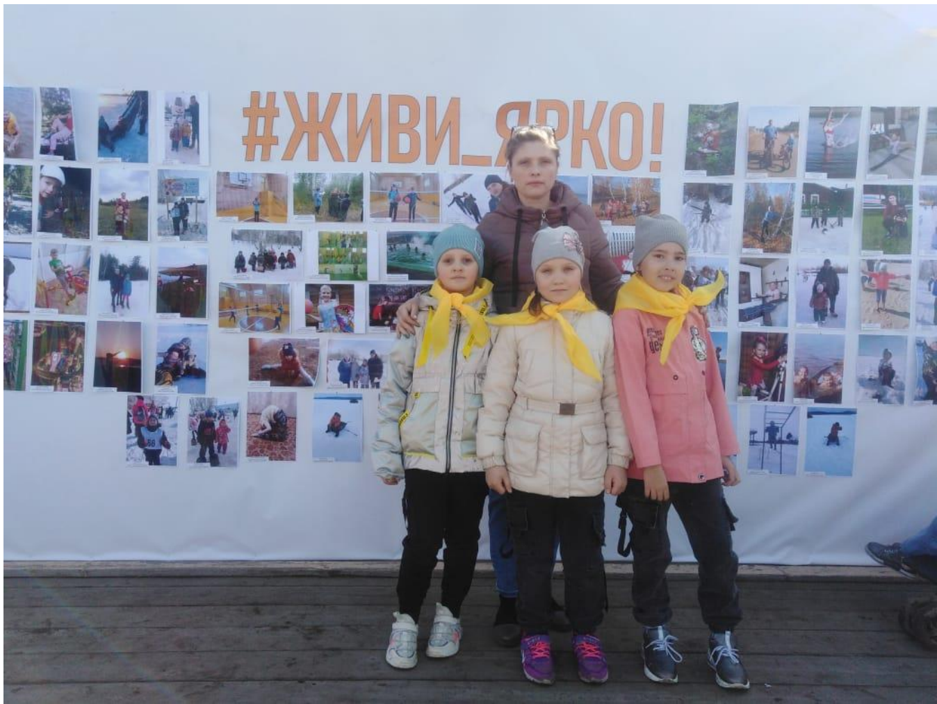
Флешмоб «Живи ярко!»