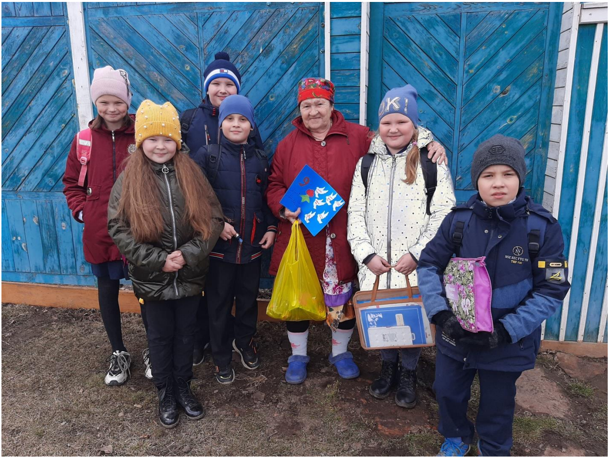
Рейд «Забота», поздравление ребенку войны с наступающим праздником Великой Победы.