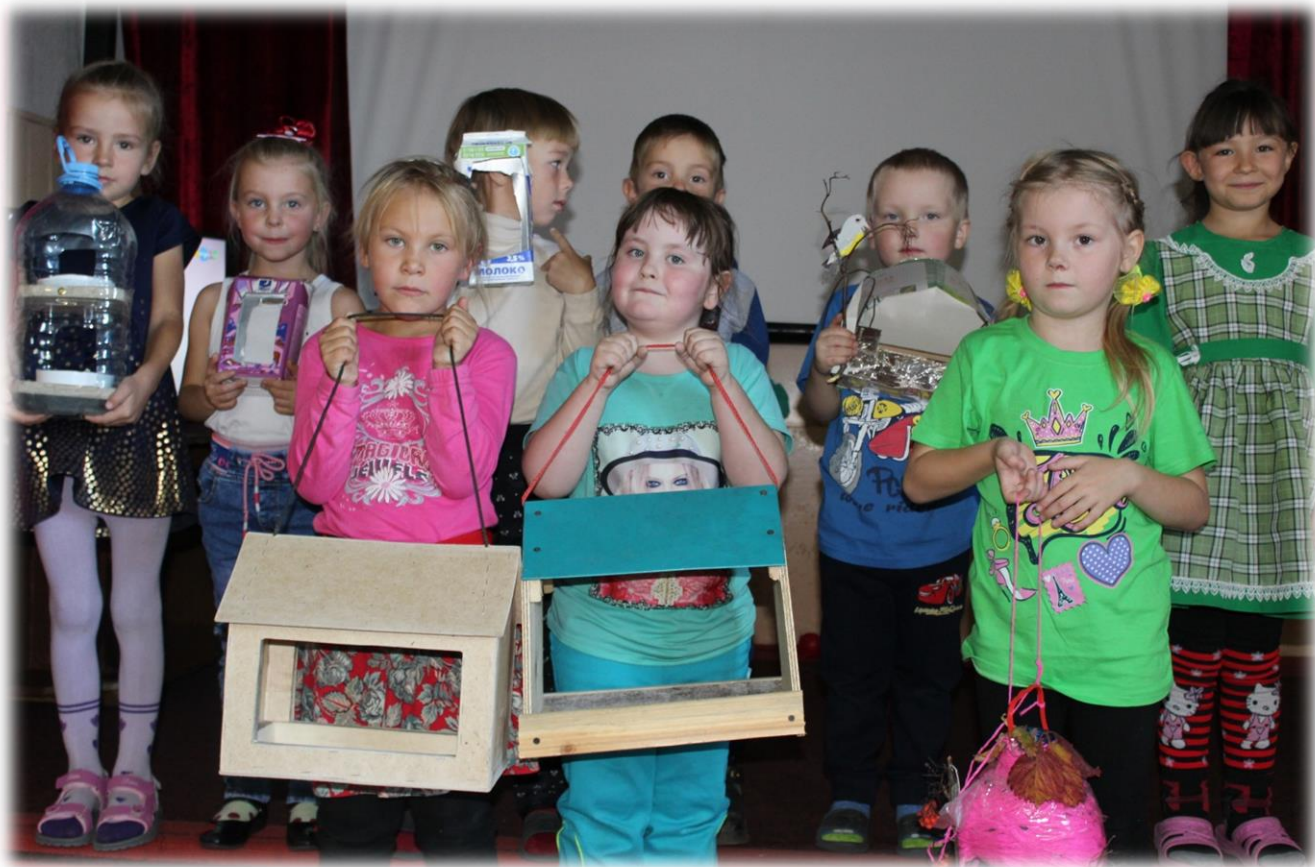
Ежегодная акция «Помоги синичке»