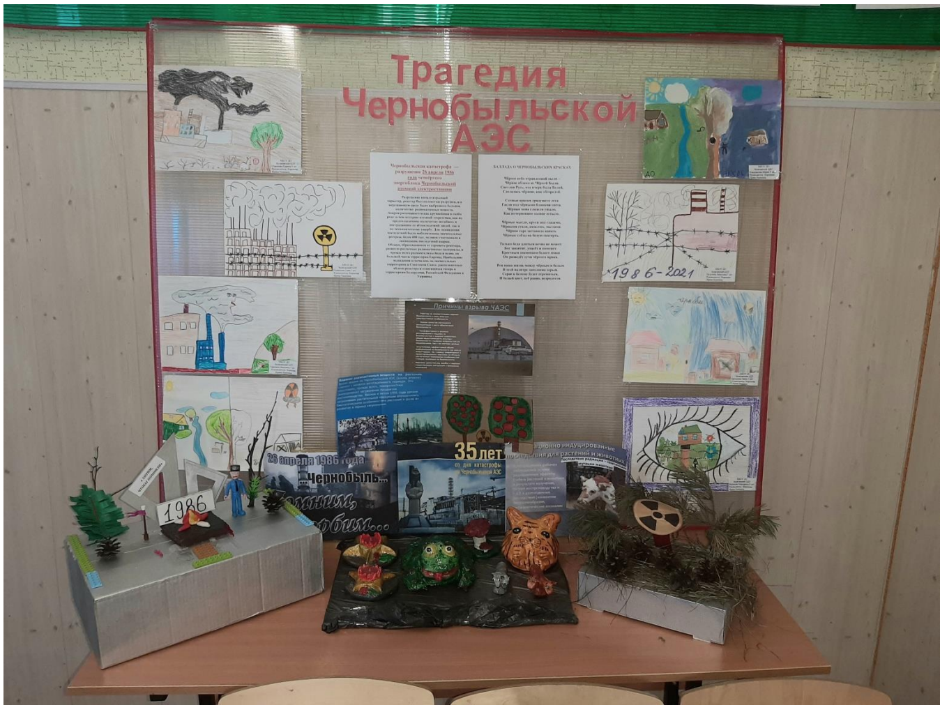
26 апреля 2021 года – особая дата... 35 лет со дня аварии на Чернобыльской АЭС. Педагогами и обучающимися была оформлена мини-выставка