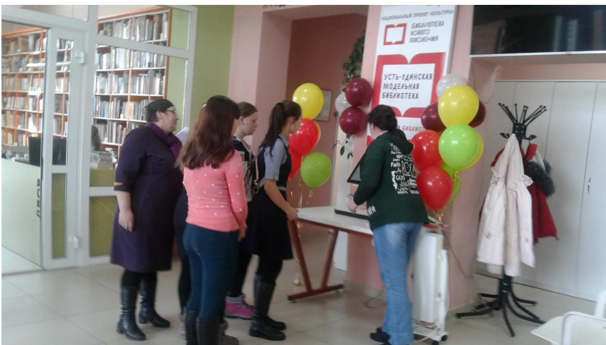
Дети старшей группы съездили на экскурсию в новую, только что открывшуюся библиотеку имени В.Г. Распутина в р.п Усть-уда