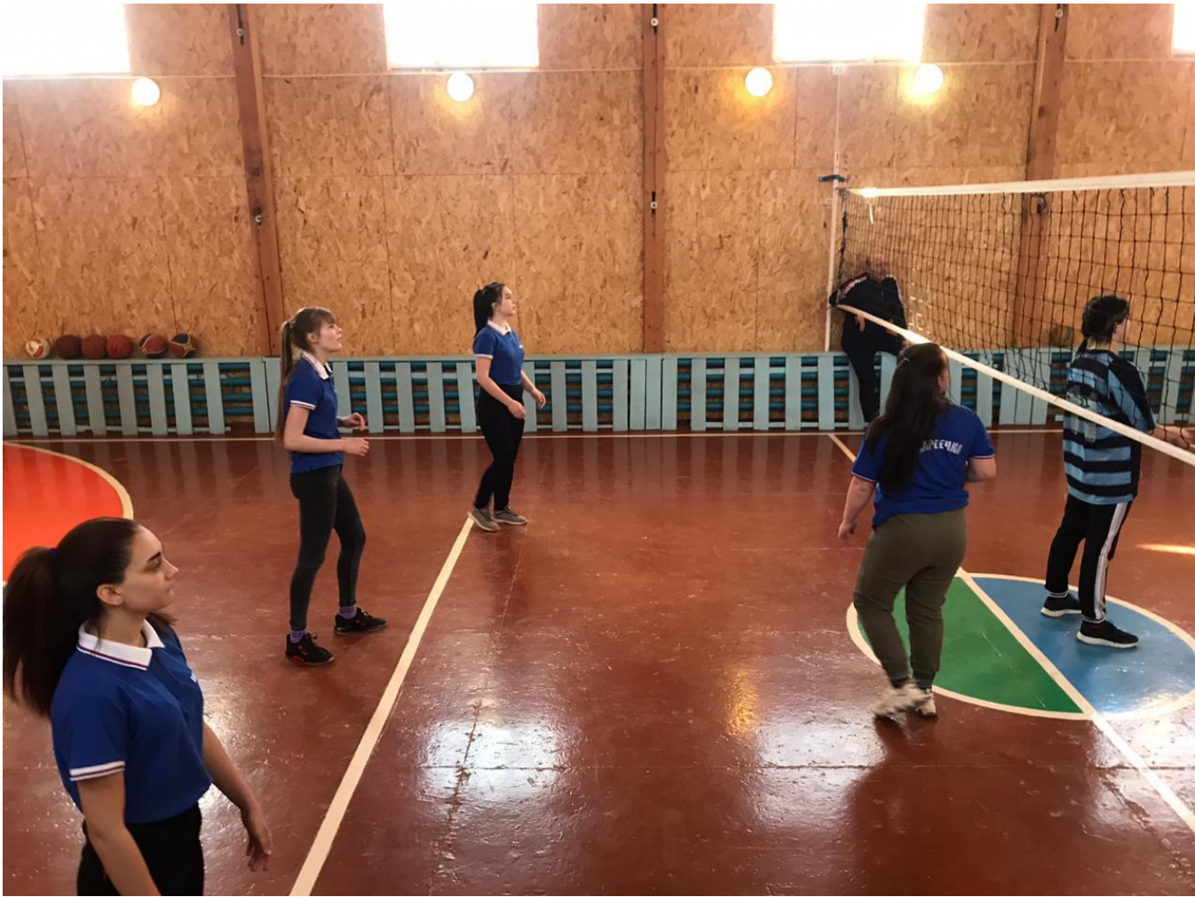
Товарищеская встреча по волейболу совместно с д/о «Олимп» д.Заславская